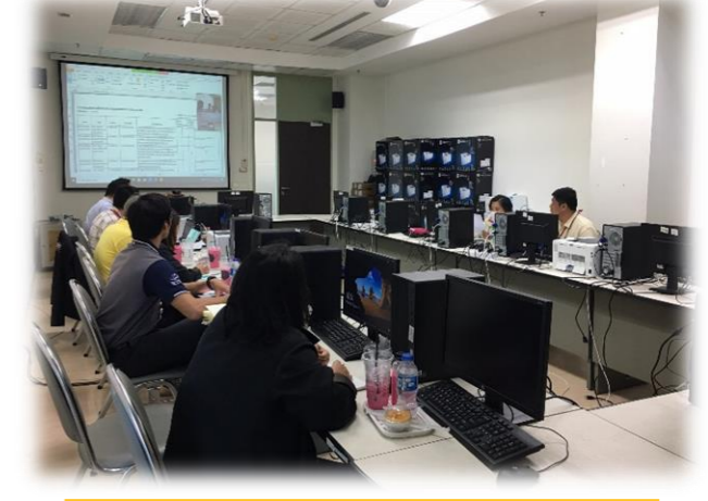
ศูนย์วิจัยโรคเอดส์ ครั้งที่ 1 และ 2